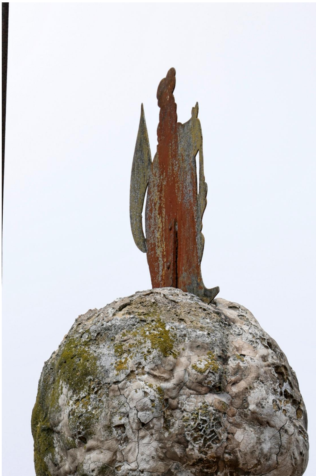
Obr. č. 1 + 2: Detailní pohled na plechovou siluetu. Ze snímku je patrný stav povrchové úpravy, která je dožilá. Památka nevykazuje mechanické poškození.